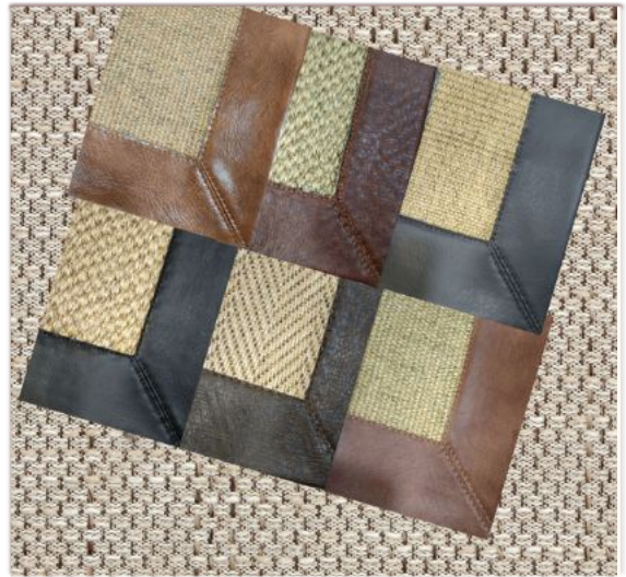
CUEROS SINTÉTICOS: Castaño, Castaño oscuro, Café claro, Café oscuro, Negro, Gris.