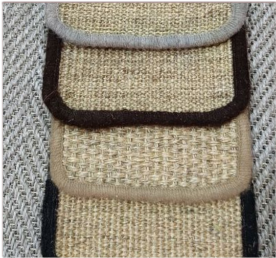
FESTON: Gris, Café, Crudo, Negro